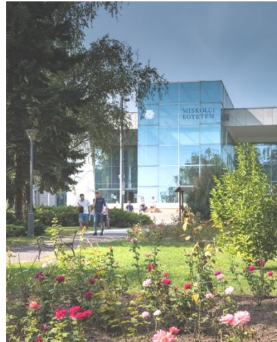
Miskolci Egyetem Főbejárata Készítette: Dr. Marinkás György

Az Állam- és Jogtudományi Kar az A/6. épületben található, megközelíthető a Főbejáraton, illetve a Diszaulán keresztül.